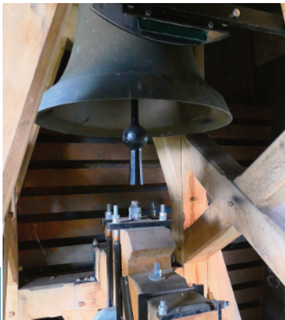
Blick auf die Glocken des Paulus-Hauses Malsch