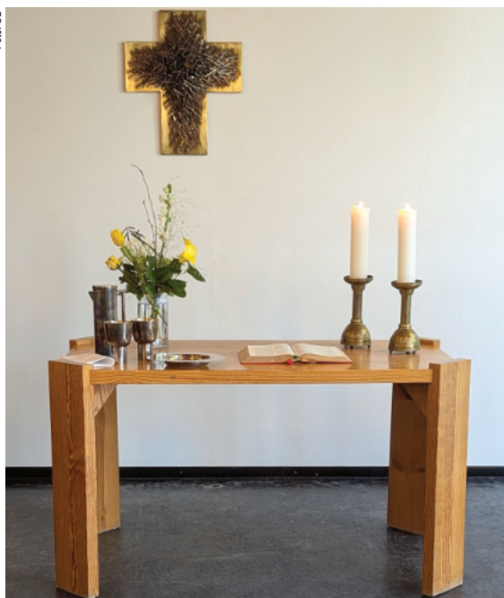
Altar im Gemeindehaus Frauenweiler vor der Entwidmung