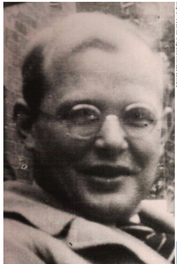
Foto: Bettina Roth: Wilhelm Roth, 1908–1967. Lebenszeugnis, Pro Business Verlag, 2008/Wikimedia Commons