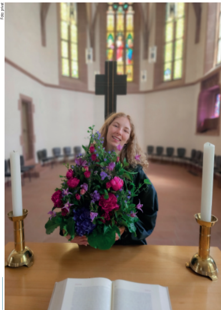
Beim Schmücken des Altars in der Stadtkirche

Dazu gibt es eine interessante Vorgeschichte. In Heidelberg nahm ich an einer dieser freiwilligen, hoch intensiven Wiederholungsveranstaltungen für das Staatsexamen teil. Nach täglich sechs Stunden harter Lernarbeit ging ich oftmals alleine in die nahegelegene Providenzkirche, um wieder „aufzutanken“. Den stillen Kirchenraum erlebte ich als Ort der Ruhe, der Sammlung und der Begegnung mit Gott. Das hat meinen Sinn für die Bedeutung und die Gestaltung von Kirchenräumen enorm beeinflusst.