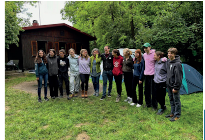
Ein ganzes Team unterstützt in Tairnbach