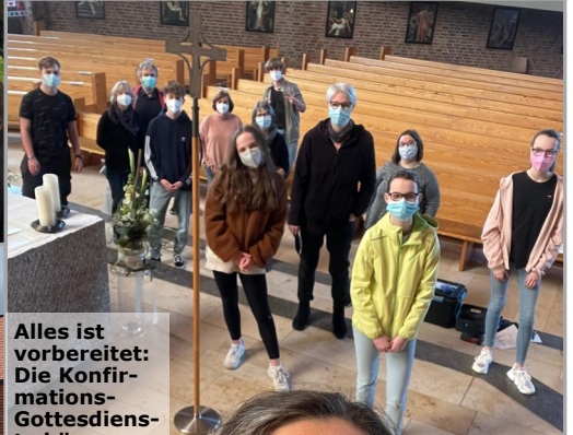
Alles ist vorbereitet: Die Konfirmations- Gottesdienste können beginnen!