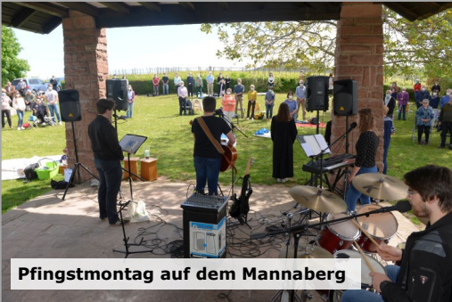
Pfingstmontag auf dem Mannaberg