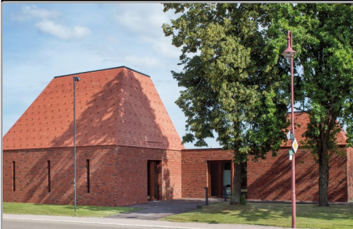
Paulus-Haus in 69254 Malsch: Rotenbergerstr. 38