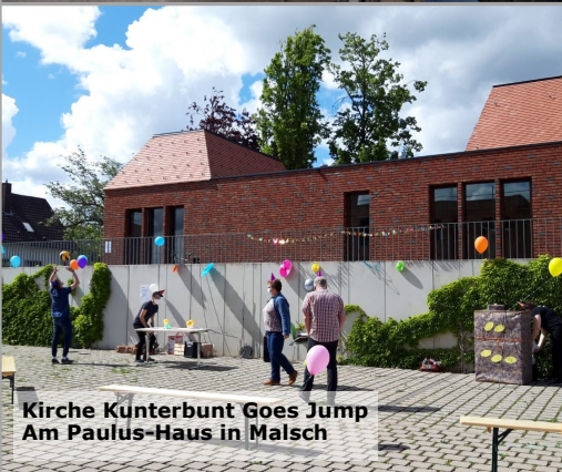
Kirche Kunterbunt Goes Jump Am Paulus-Haus in Malsch