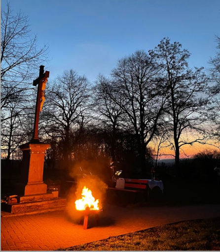
Das Osterfeuer brennt!