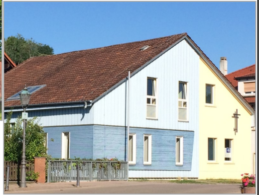
Gemeindehaus in 69231 Rauenberg: Hauptstr. 59