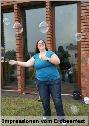
Impressionen vom Erdbeerfest