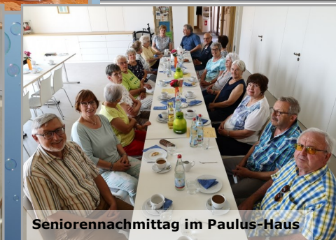
Seniorenachmittag im Paulus-Haus