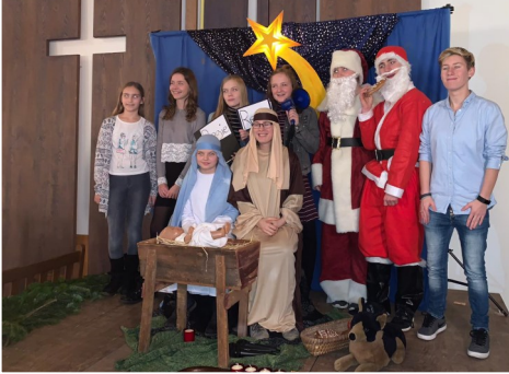
Krippenspiel in Rauenberg und Malsch