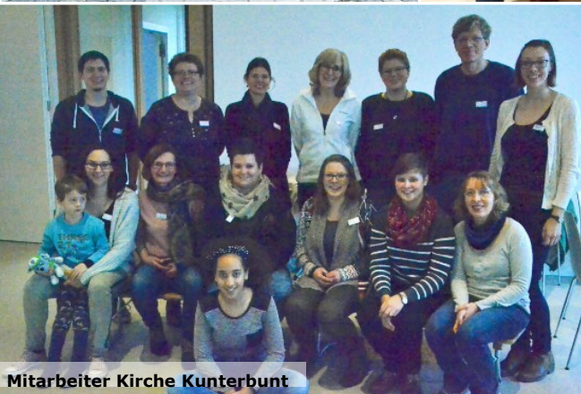
Mitarbeiter Kirche Kunterbunt