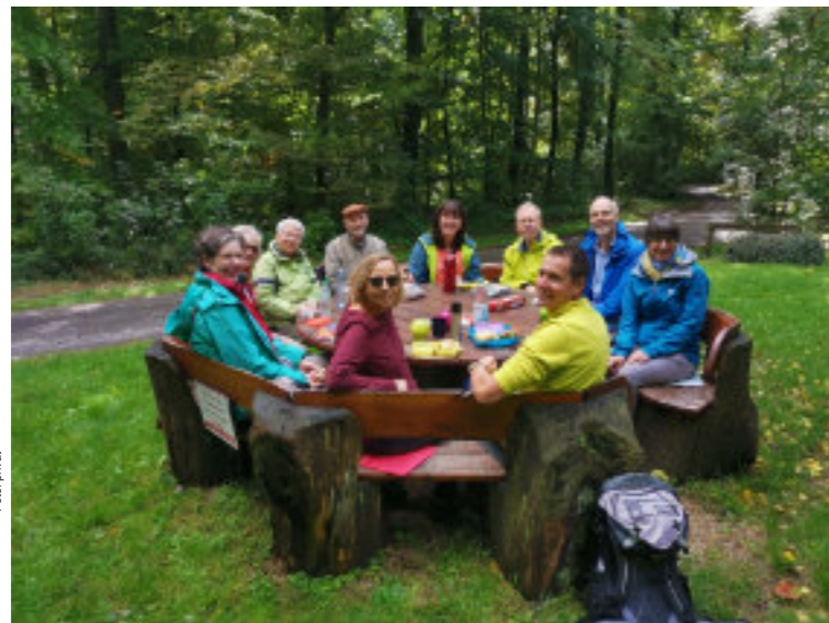
Gemeindegewandern im Oktober