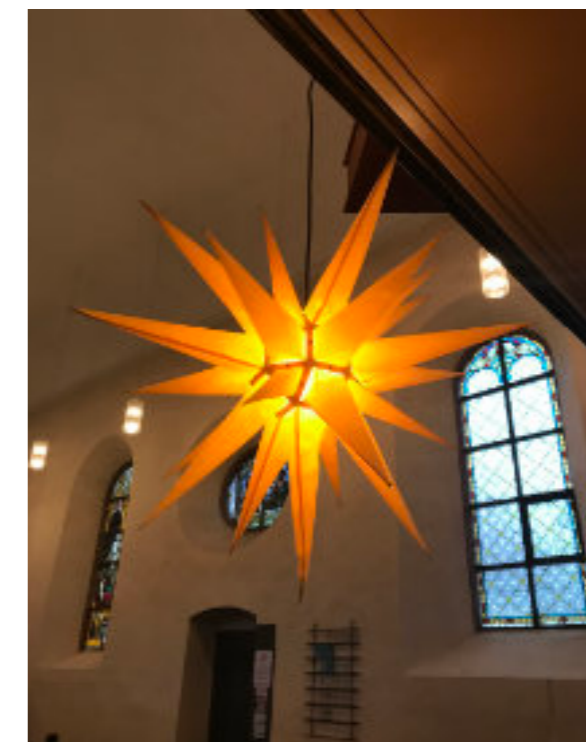
Herrnhuter Stern in der Stadtkirche im Advent

Adventslied kann man natürlich trotzdem noch singen, falsch ist es ja nicht, zumal der Kehrsatz im ganzen Advent gilt: „Freut euch, ihr Christen! Freuet euch sehr. Schon ist nahe der Herr.“ → HF