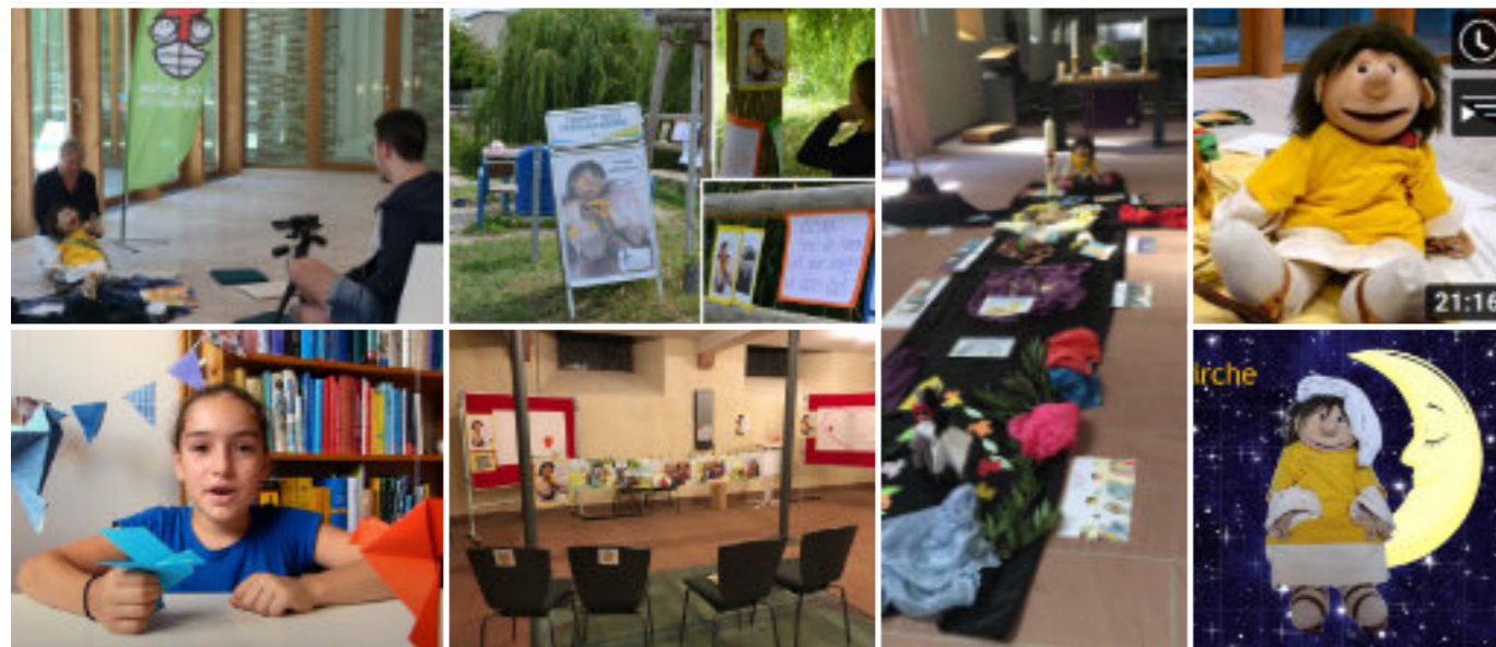
Vielfältige Impressionen aus zwei Jahren KiGo in der Coronazeit