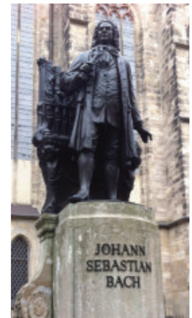
Das Bach-Denkmal an der Südseite der Thomaskirche in Leipzig