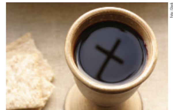
Das Abendmahl: Erinnerung an die stellvertretende Lebenshingabe von Jesus für uns