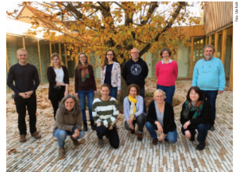
Die Hauptamtlichen der Region »Südost« des Kirchenbezirks »Südliche Kurpfalz«

Der nächste Konfi-Jahrgang ist mit 41 Jugendlichen gestartet, die sich einmal im Monat sams-