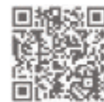
Hier geht's zum musikalischen Adventskalender!