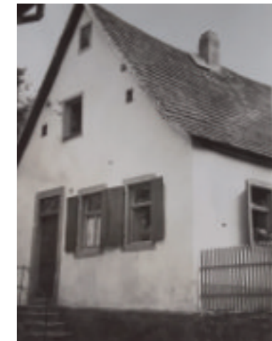
Das Haus in der Pfarrstraße 7 stand dort, wo heute der kleine Park hinter dem Rathaus ist