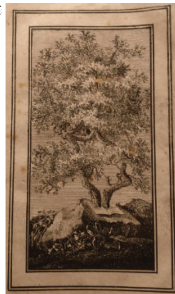
Zeitgenössische Darstellung der Union: Zwei Bäume entspringen der Bibel und wachsen zusammen Quelle: Litographie von Rudolf Schlicht