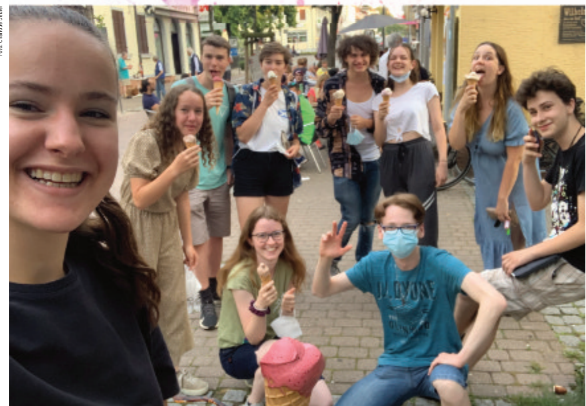
Da ist der Name »Refresh« Programm: Der Jugendkreis der Petrusgemeinde bei einem erfrischenden Eis in der Hauptstraße