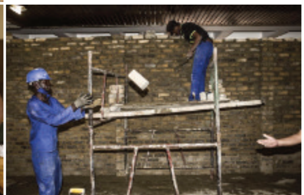
Eine Ausbildung schafft Zukunft für junge Menschen in Südafrika: Helfen Sie mit!