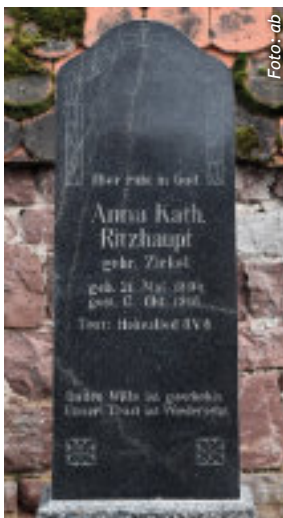
Der Gedenk-Grabstein aus der Zeit der »Spanischen Grippe«

Körperliche Trennung soll aber nicht auch geistliche Isolation bedeuten. Wenn kirchliche Angebote ausfallen, ist es umso wichtiger, dass wir spüren: wir gehören als Gemeinde zusammen. »Wo zwei oder drei versammelt sind in meinem Namen ...« - die Zusage gilt auch, wo wir uns nur in Gedanken versammeln, sei es im Hören auf die Gebetsglocke der Stadtkirche oder online im Internet. Auch über Konfessionsgrenzen hinweg: Ab Ostern steht die traditionell von der katholischen Schwesterngemeinschaft gestaltete Osterkerze in unserer Kirche. Schauen Sie rein, falls Sie in der Nähe sind - einzeln und