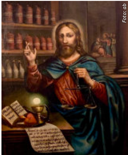
Jesus als Apotheker - ein Bild im Deutschen Apotheken-Museum im Heidelberger Schloss

■ »Gott ist unsre Zuversicht und Stärke, eine Hilfe in den großen Nöten, die uns getroffen haben.« (Ps 46,2)